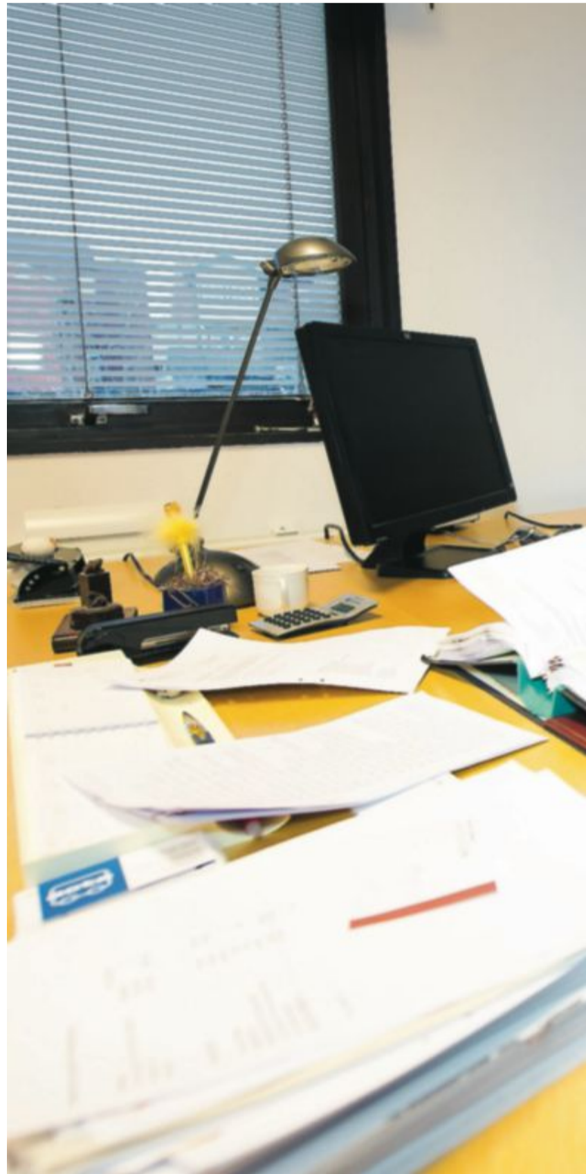
STOPP. Den politiska osäkerheten har satt stopp för Achima Cares utbyggnad

NOBBEN. Brevet till Lars Brune från kontaktpersonen vid banken SEB visar hur kapitalbromsen har slagits till för vårdföretagen.